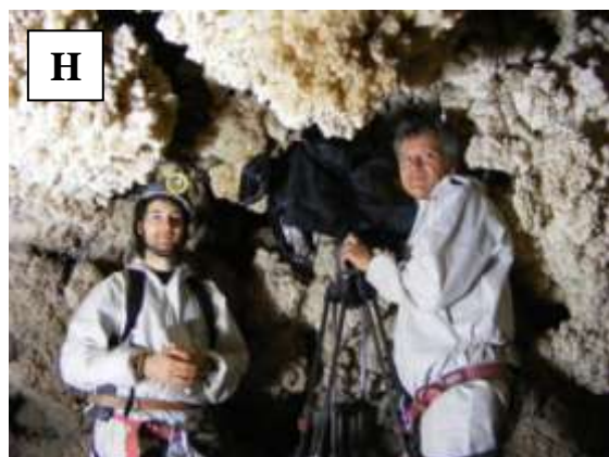
Figura 1. Desarrollo de diferentes actividades de difusión de la Cueva de Nerja.